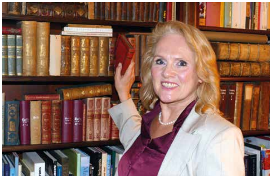
Bild- und Zeitdokumente, interessante Fakten, Berichte und persönliche Geschichten machen die Caritas-Arbeit der vergangenen 100 Jahre hautnah erlebbar. Lassen Sie sich überraschen und kommen Sie mit auf eine Zeitreise über ein ganzes Jahrhundert Caritas in Koblenz und Umgebung!

Die Chronik kostet 15 Euro und ist an folgenden Stellen erhältlich: