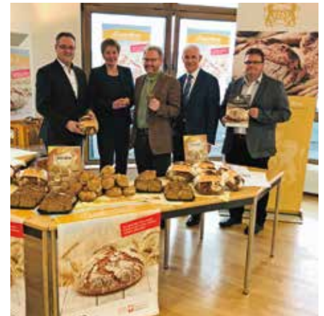
Vorstellung des Rosenbrottes beim Neujahrsempfang der Bäcker-Innung.

Eine Übersicht über alle teilnehmenden Mitgliedsbetriebe gibt es ab Mitte Februar unter www.caritas-koblenz.de .